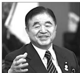
日本奥运担当大臣远藤利明(资料片)

本报讯 据日媒报道,安倍内阁成员、日本奥运担当大臣远藤利明,近日被指出在2010年至2014年的五年间,收受东京一家民间企业负责人955万日元(约合人民币53.289万元)的个人献金,间接助其谋取经济利益。