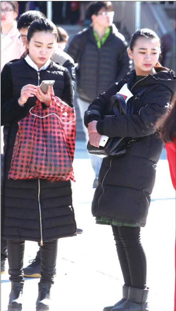
济南艺术学校,大批参加艺考的女生青春靓丽。

“今天上午查出了一名替考考生,已经交由公安机关进行处理。”对此,该校工作人员也进行了确认,由于作弊,报考者和替考者将面临法律的惩罚。