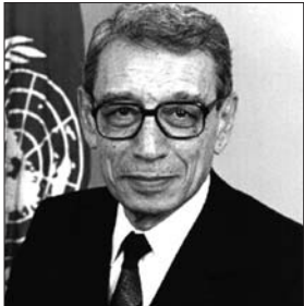
联合国第六任秘书长加利