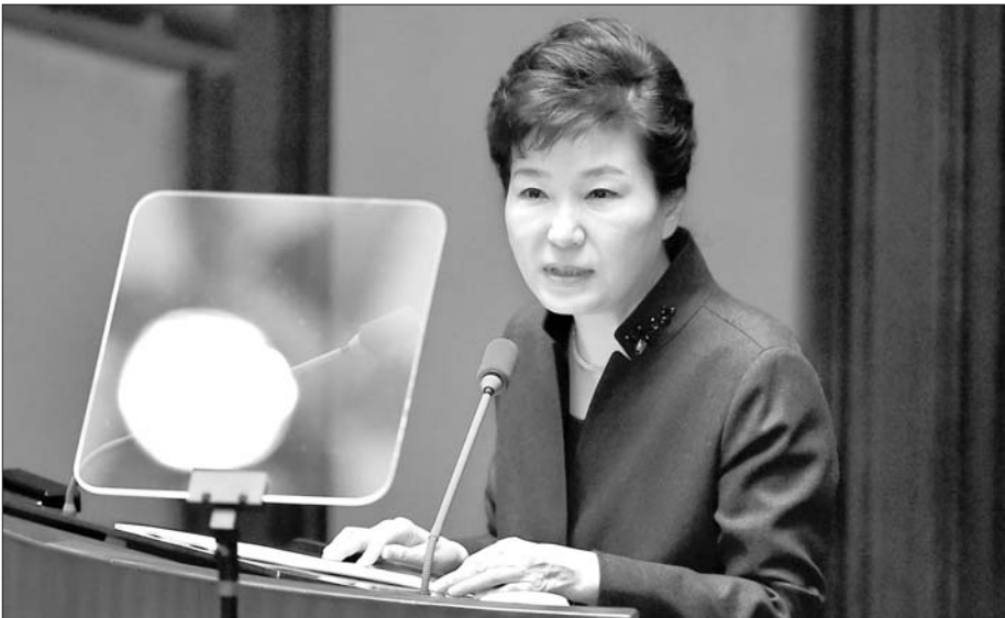
2月16日，在韩国首尔，韩国总统朴槿惠在国会发表演讲，称韩国政府将采取强有力的措施促使朝鲜发生改变。

针对安理会是否应通过新决议，使朝鲜为其行为付出必要代价，外交部发言人洪磊在16日举行的外交部例行记者会上表示，安理会采取的新的措施，目的应是有效遏制朝鲜进一步发展核导计划。外交部发言人洪磊指出：“近期，我们已就安理会讨论新的对朝制裁决议表明了立场。我们支持安理会通过新的决议，其目的应是有效阻遏朝鲜进一步