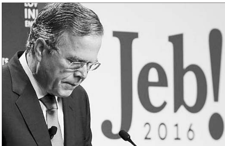
20日,杰布·布什在南卡罗来纳州党内预选结束后宣布退出2016年美国大选。

美国民主、共和两党当地时间20日分别在內华达州和南卡罗来纳州举行2016年总统选举第三站预选,希拉里和特朗普不出意外地各自轻松获胜,表现惨淡的老布什之子、小布什之弟杰布·布什(J 布什)黯然宣布退选。