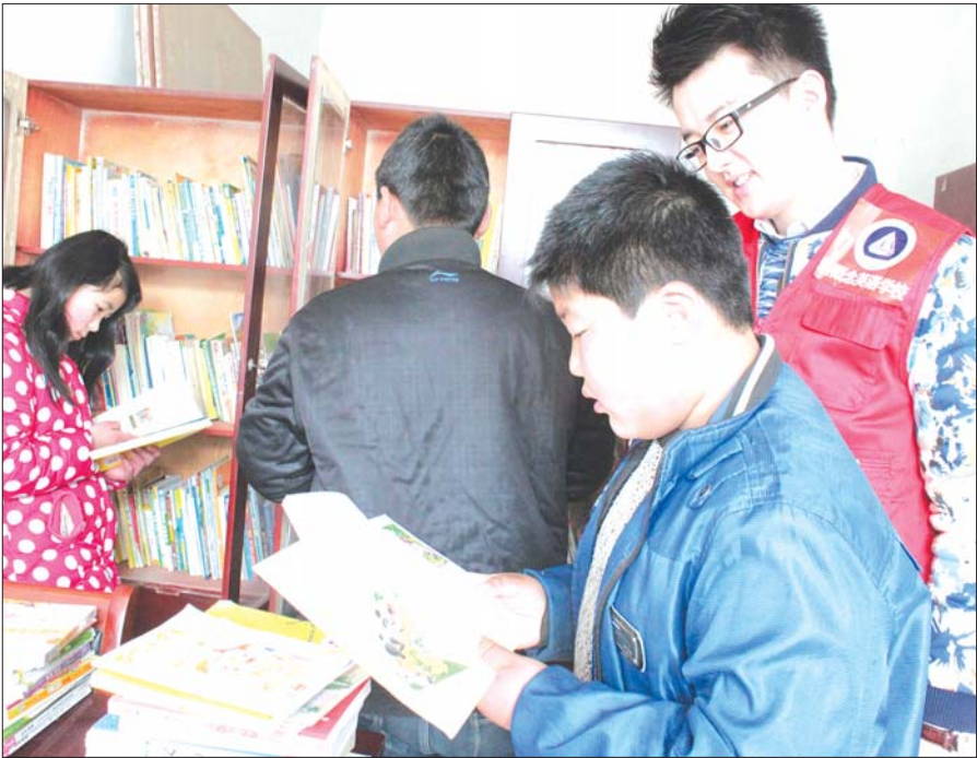
图书刚摆上书橱,孩子们迫不及待地读起来。

在董花园村,爱心书屋室内刚整理好,村支书董圣曾就迫不及待地吧爱心书屋的牌子挂在门口最显眼的地方。孩子们蜂拥地挤进书屋,面对满满的书柜他们不知该选那本书好,索性先挑一本颜色鲜艳