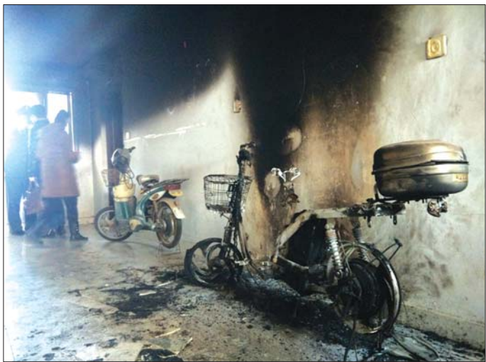
起火电动车旁边,停着一辆充电的电动车。

本报泰安2月23日讯(记者 张伟) 1月31日,泰安华易青年城,18层居民楼楼道内,一辆电动车突然起火,浓烟蔓延整个楼道,电动车烧得只剩下一个骨架。记者走访泰城多个小区发现,居民在楼道内随意停放电动车,私自拉扯电线为电动车充电现象比较普遍,而这一行为,也为自身埋下了很大的安全隐患。