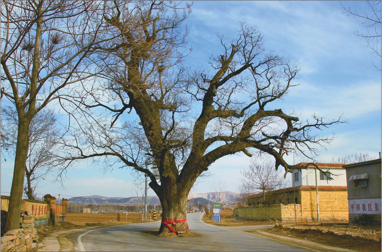
胡林大槐树已被济南市绿化委员会钉牌保护,编号为“济南市古树名木A6-0046”。