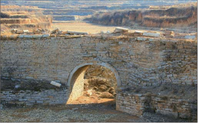
由于跨度大、质量一般以及超负荷使用,胡林大石桥变成危桥而退役。