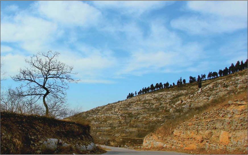
胡林坡附近燕付公路的险要一段。