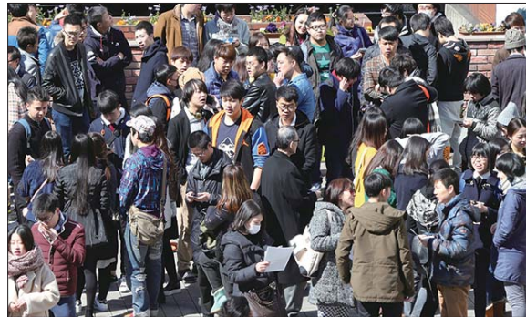
2月26日,人们站在日本东京一广场上。