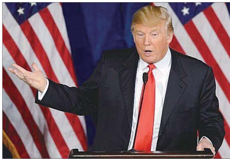
特朗普在25日的电视辩论会上。