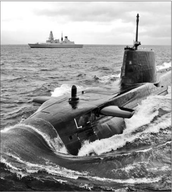
英国海军45型驱逐舰和“前卫”级核潜艇。(资料片)

戟”导弹的正常运作,英国就要花费30亿英镑。而在2015年“前卫”级机械师麦克奈利向“维基解密”网站提交的报告中,“前卫”级被描述为装载着一群漫不经心的官兵的“漏洞