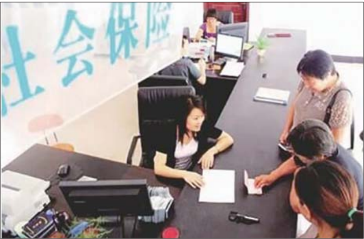
居民正在询问社保政策。(资料片)

听说,今年政府有意给我减减负,降一降“五兄弟”的占比,而且同时会保证我主人的社保待遇不降低。那么,如何减负呢?代表委员们对此有什么建议呢?