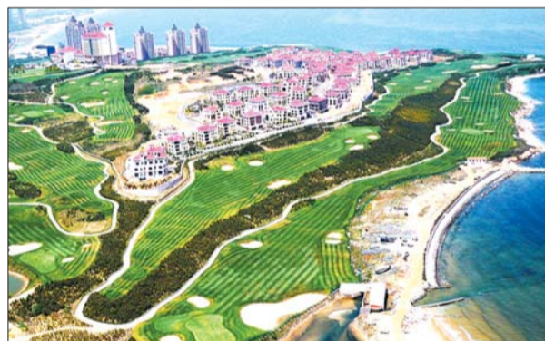
▲马山寨 地点:烟台 器材:亚拓800+松下GH4 (拍客奖100元)