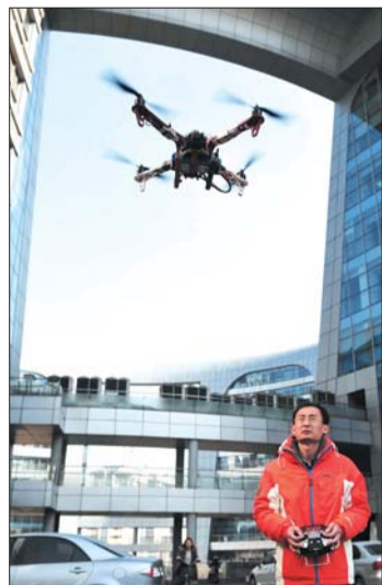
▶教练操作组装好的无人机。