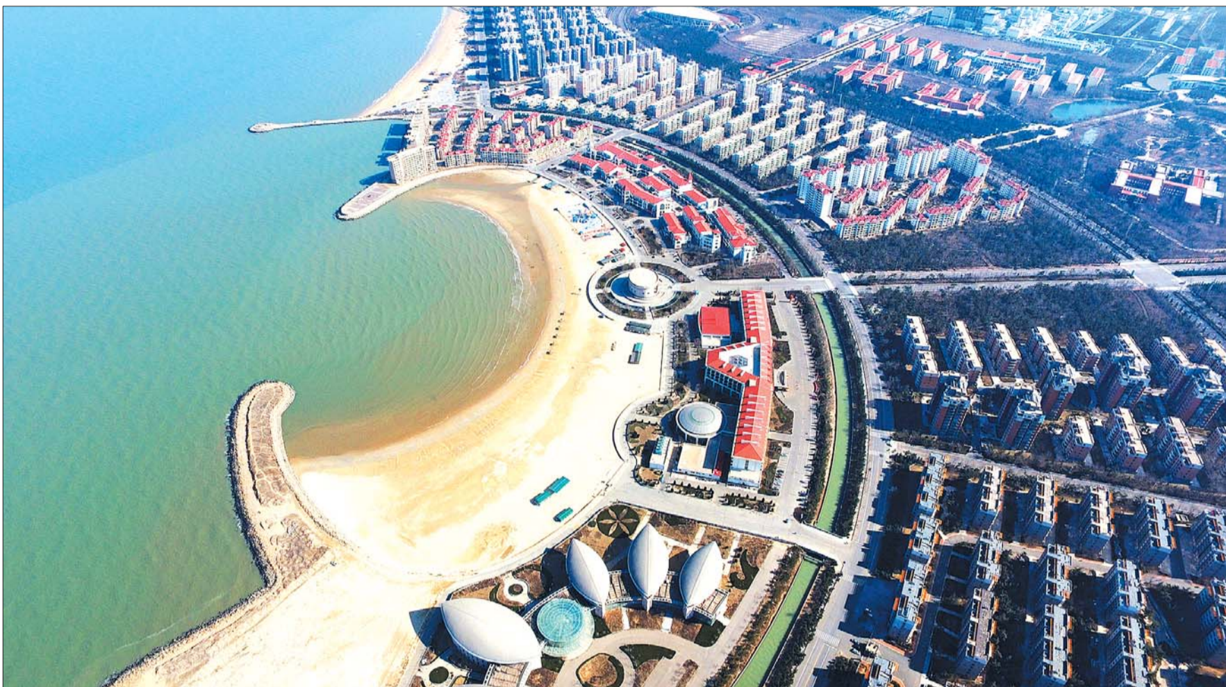
▲海滨 作者:车响午 时间:2016年2月21日 地点:龙口 器材:大疆悟 (拍客奖100元)

“瞰齐鲁”栏目面向读者征集航拍照片及视频,作品重在用崭新的视角观察我们的家园,投稿邮箱qlwbsyb@sohu.com,来稿请注明拍摄时间、地点、器材型号、通信地址、联系电话和真实姓名。作品将择优刊登在齐鲁晚报拍客版、齐鲁壹点手机客户端摄影频道。