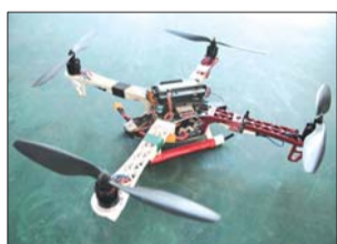
▲学员自己组装调试的无人机,学完归自己了,人手一架。