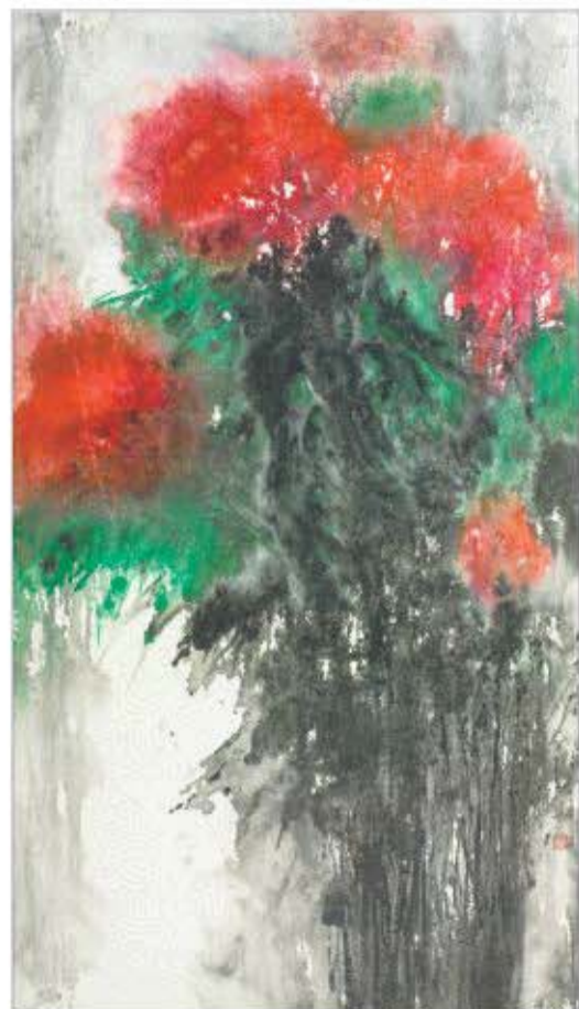
▲印象水墨 180 x110cm 综合材料绘画

杜华,女,现任济南市美术馆馆长、济南画院院长,国家一级美术师,中国美术家协会理事,中国艺术研究院研究员,中国美术家协会综合材料绘画与美术作品保存修复艺术委员会委员,山东省美术家协会副主席,山东省政协协理员,山东省美术家协会策展委员会主任,山东艺术学院美术学院客座教授,济南市文学艺术界联合会副主席,享受国务院政府特殊津贴。先后在法国埃克斯国家艺术学院和中央美术学院作高级访问学者。