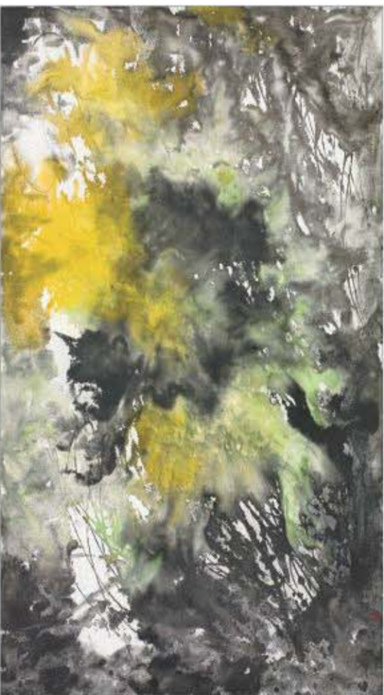
▲印象水墨 180 x110cm 综合材料绘画