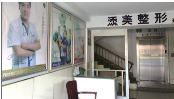
▲王女士称左下角的签名不是她写的。