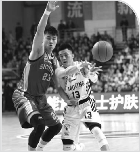
混迹总决赛多年，陪跑的辽篮终于看到转正的希望。

值得一提的是，这场胜利也是辽宁六次征战总决赛，首次取得系列赛开门红。数据显示，CBA总决赛历史上，拿下系列赛开门红的球队，夺冠的几率高达75%。对于经验更丰富，队员实力更加均衡的辽篮而言，夺冠的几率已经大大增加，双方第二场比赛将于周日继续在本溪进行。