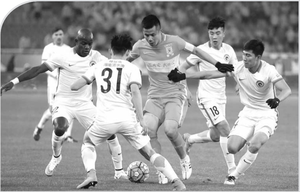
取得中超首胜，鲁能将迎来亚冠的考验之战。