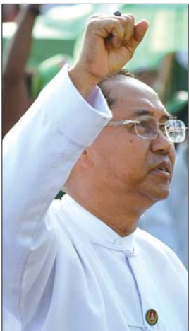
仰光省省长吴敏瑞