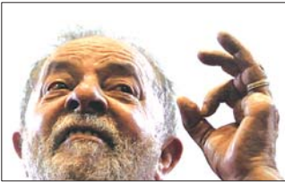
巴西前总统卢拉(资料片)

据新华社圣保罗3月10日电 巴西《环球网》10日报道,巴西圣保罗州检察官日前指控巴西前总统卢拉涉嫌洗钱、隐匿资产,并要求在司法部门调查该案过程中对卢拉实行“防范性监禁”。根据巴西法律,检察官的指控还需被法院法官接受,被指控人才会成为被告。