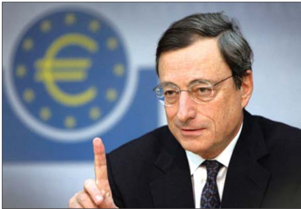
欧洲央行行长德拉吉。(资料片)

欧洲央行10日打出重拳,把欧元区主导利率下调至零的历史最低水平;同时下调隔夜贷款利率和隔夜存款利率分别至0.25%和-0.4%。欧洲央行行长德拉吉暗示,“超低利率”将再持续至少1年,欧元区今后数月仍将深陷通缩泥潭。