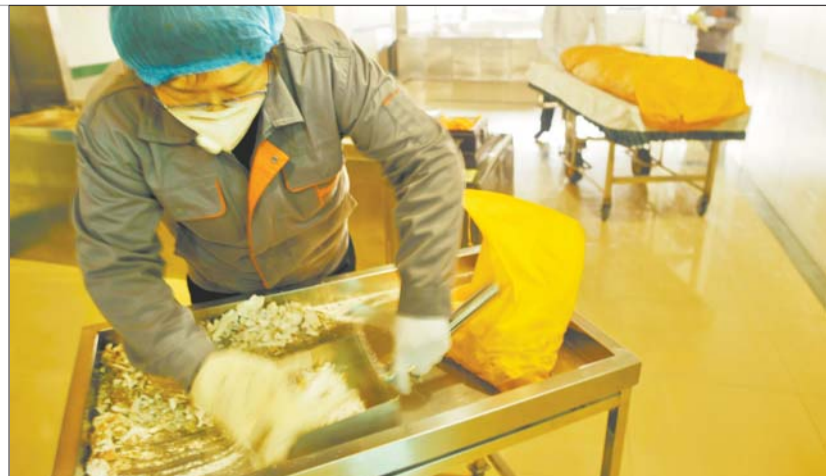
有时工作很密集,经常是前面的骨灰还没捡完,后面待火化的遗体已经推过来了。