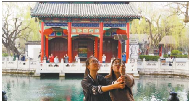
17日下午,两名女孩在趵突泉边自拍留念。

17日,黑虎泉的水位为27.64米。同趵突泉一样,进入3月份以来,黑虎泉的水位也是以每天1厘米多的速度持续下跌。由于黑虎泉的地势较高,当黑虎泉的水位跌到27.30米左右时,三个兽头便