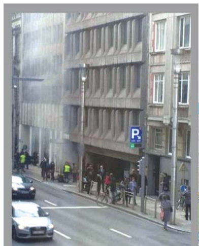
▼组图:22日,布鲁塞尔市中心马埃勒贝克地铁站发生爆炸后冒烟,随后救援人员赶到现场救助伤者。