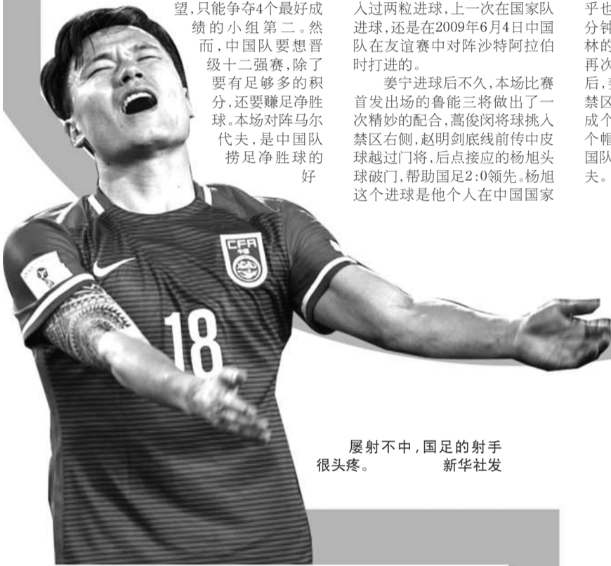
屡射不中，国足的射手很头疼。