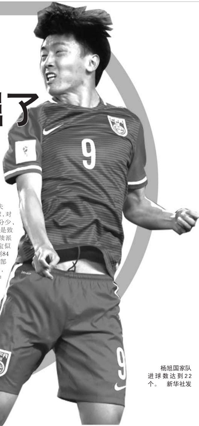
杨旭国家队进球数达到22个。