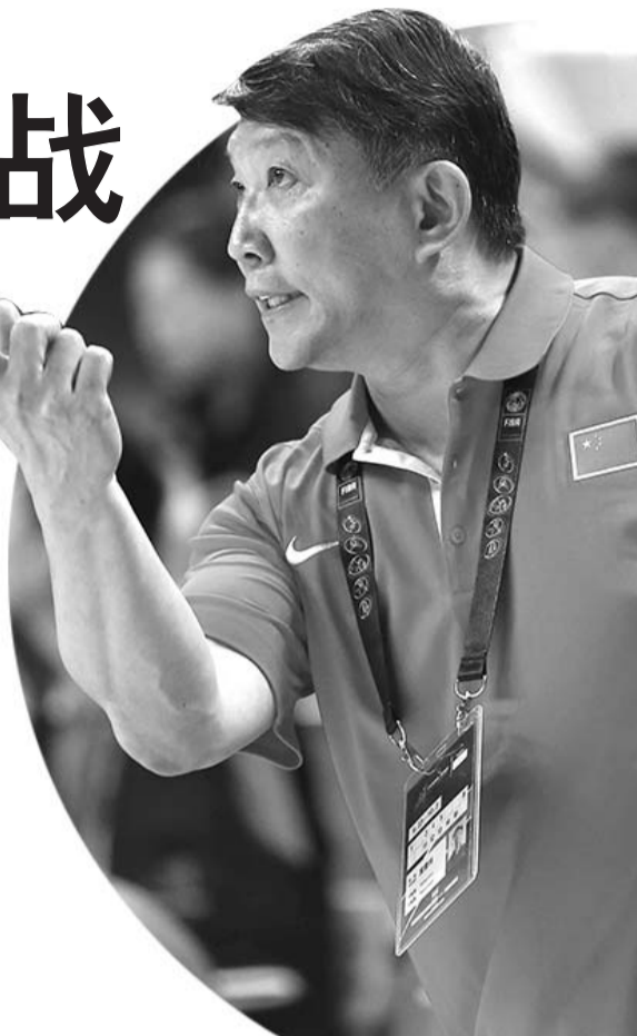
宫鲁鸣与篮协有分歧,男篮备战何时步入正规化?

宫鲁鸣是中国篮坛的功勋教练。1996年,他曾率领中国男篮在亚特兰大奥运会上获得第八名,实现了历史性突破。