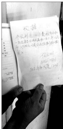
李美莲购买净水器的收据。