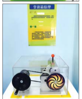
和平路社区科普体验馆,将打造成全民动手的体验式“科普馆”。本版图片为各项目展示。