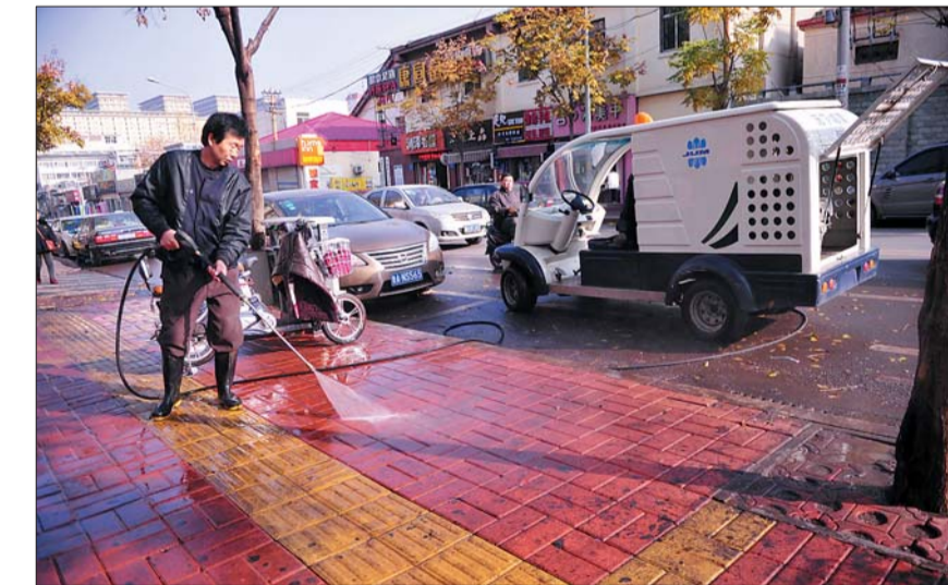
文东环卫所的王师傅正在山师东路清洗人行道。

兼顾环境和民生,改善居民生活环境。目前,为便利居民生活在上级部门批准下,设立了几处规范化的便民餐车和早餐点。有居民通过热线反映,认为早餐点与便民餐车影响通行,要求取缔或改善。办事处在征集周边群众意见的基础上,从兼顾环境卫生和民生便利角度出发,针对部分便民早餐点和