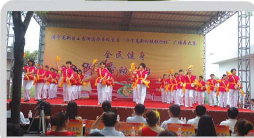
▲丰富多彩的文化活动。