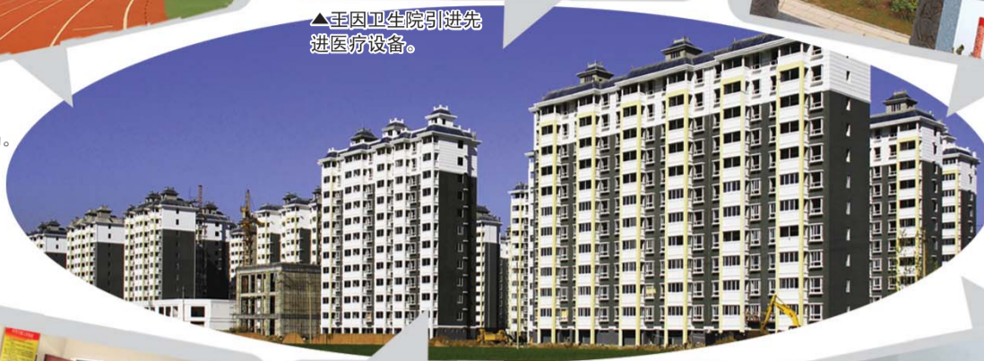
▲仁美社区一期已经上房。