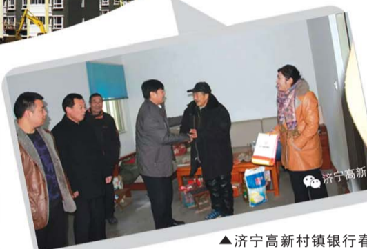
▲济宁高新村镇银行春节走访慰问。