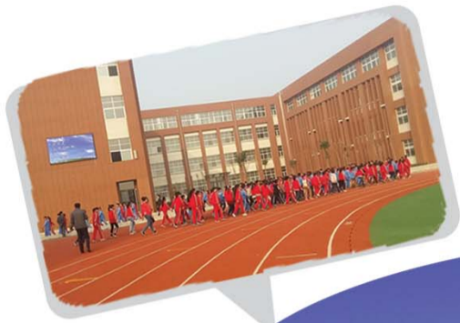
▲王因中心小学塑胶操场。