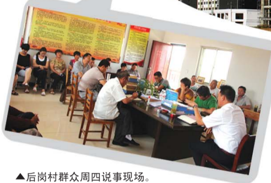
▲后岗村群众周四说事现场。