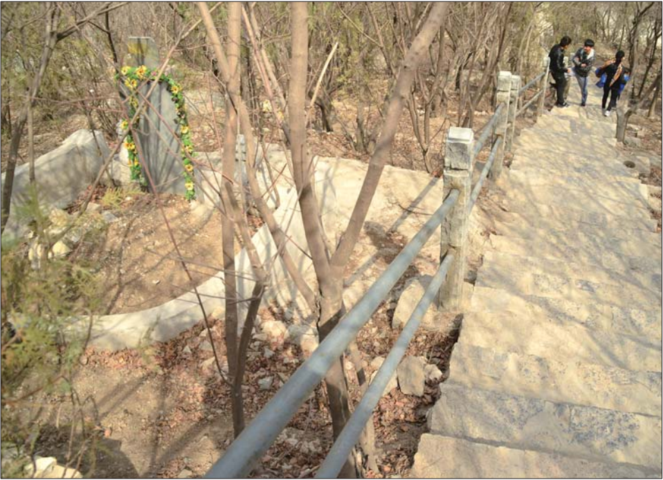
很多山体公园内都有私建的坟墓。(资料片)

根据记者连日来的探访,山体公园里建墓地的情况除了茂陵山外,英雄山、腊山、药山、燕翅山、郎茂山等山体均有。据官方统计,仅济南市园林局直属的景区中就有7个墓地,墓穴总数近4万个。