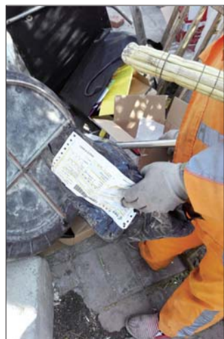
环卫工人在路边垃圾桶捡来的快递垃圾。