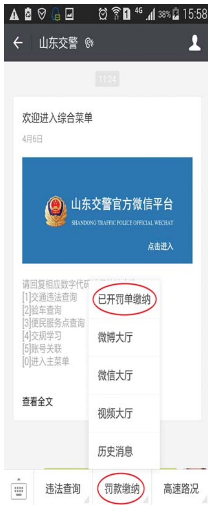
“山东交警”公众微信号界面