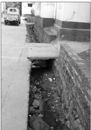
突泉水位大降,位于村内的沟渠已经干涸,部分沟渠内还有污水。