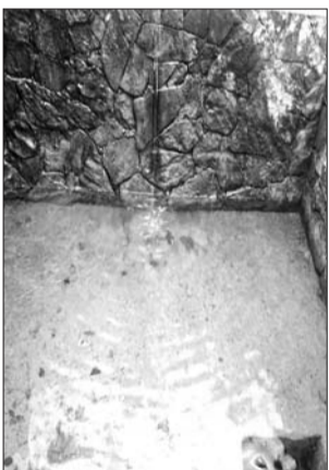
斗母泉的泉池基本见底。