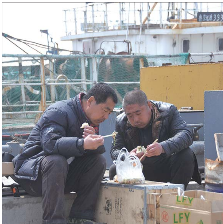
船靠岸后修整,留守的船员正在吃午饭。