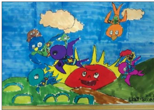
文化路小学二年级一班 孟启奥 《春天的燕子》