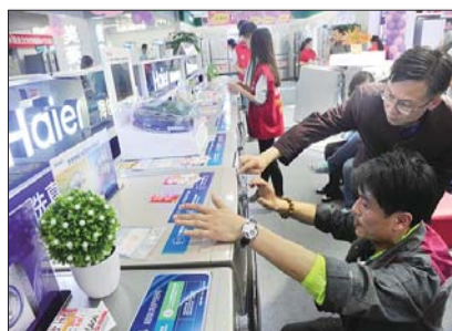
▲15日,海尔内购会第一天,在各大卖场,海尔专柜都是人头攒动。