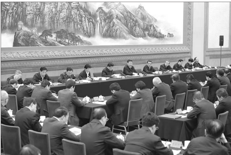
4月19日,中共中央总书记、国家主席、中央军委主席、中央网络安全和信息化领导小组组长习近平在北京主持召开网络安全和信息化工作座谈会并发表重要讲话。

习近平指出,中国开放的大门不能关上,也不会关上。外国互联网企业,只要遵守我国法律法规,我们都欢迎。要聚天下英才而用之,为网信事业发展提供有力人才支撑。要不拘一格降人才,解放思想,慧眼识才,爱才惜才。对待特殊人才要有特殊政策,不要求全责备,不要论资排辈,不要都用一把尺子衡量。要建立灵活的人才激励机制,让作出贡献的人才有成就感、获得感。要构建具有全球竞争力的人才制度体系。不管是哪个国家、哪个地区的,只要是优秀人才,都可以为我所用。