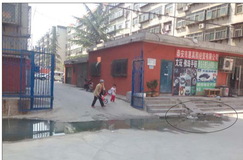
污水就是从这里(圆圈处)溢出的。

记者来到利民社区居委会,居委会工作人员表示,污水外溢是因为门头房下面的化粪池满了,但是门头房房主不同意破开地面抽化粪池,所以污水一直往外淌。居委会将继续和门头房房主协商,尽快修好。