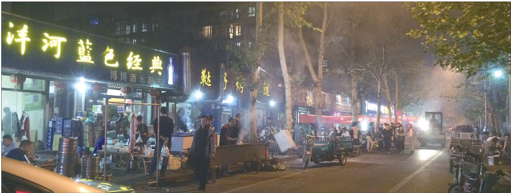
治理了十几年,露天烧烤仍没有绝迹。