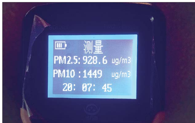
20日晚8点,记者在工商河路西侧烧烤摊实测PM2.5数值为928.6。

此外,刘林表示,尽管烧烤摊都安装了油烟净化设备,但使用率却不高。在他看来,不能说安了就万事大吉,后期使用的监管必须到位。