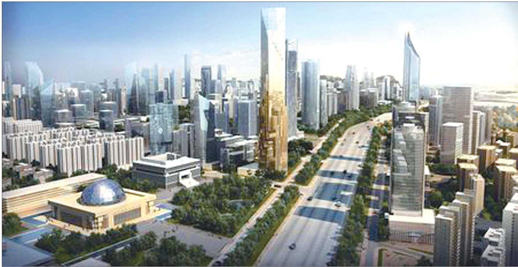
不久的将来,CBD或将成为“济南的华尔街”。(效果图)