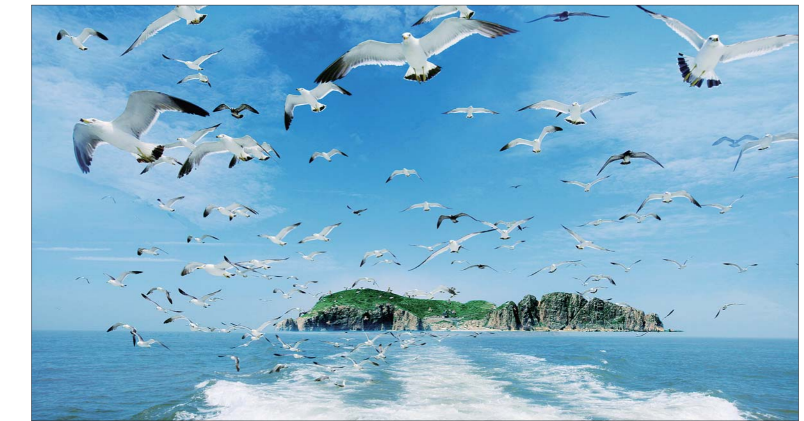
威海西霞口海驴岛鸥鹭蔽日。

3 文化遗产游——沿运河访古迹,欣赏国内罕见的水上森林 【推荐理由】:台儿庄古城是世界文化遗产——大运河的中心点,国家5A级旅游景区。位于滕州市的微山湖湿地红荷旅游景区,古运河流经此处,总面积90平方公里,十万多亩的野生红荷、数十平方公里的芦苇荡及国内罕见的水上森林,风光旖旎,美不胜收。在聊城,古运河西岸的山陕会馆是全国重点文物保护单位,琼楼玉宇,雕梁画栋。