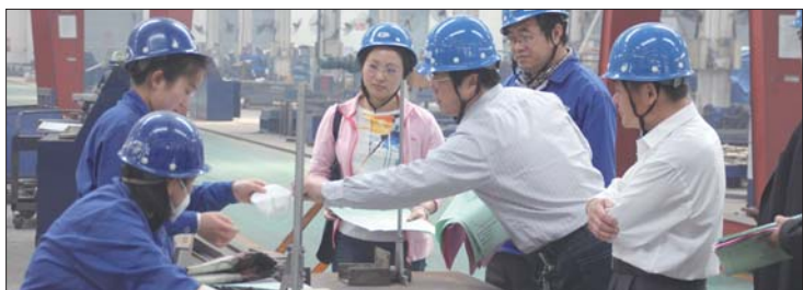
领导向工人发放职业病防治知识宣传单、宣传手册。