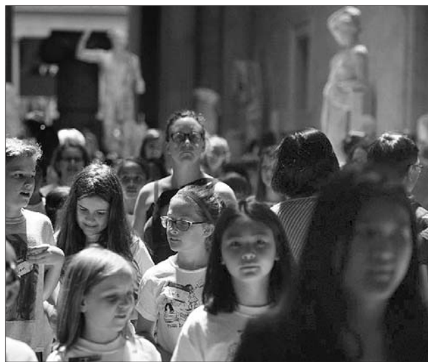
在参观纽约大都会博物馆的游客中，能看到不少中国面孔。(资料片)