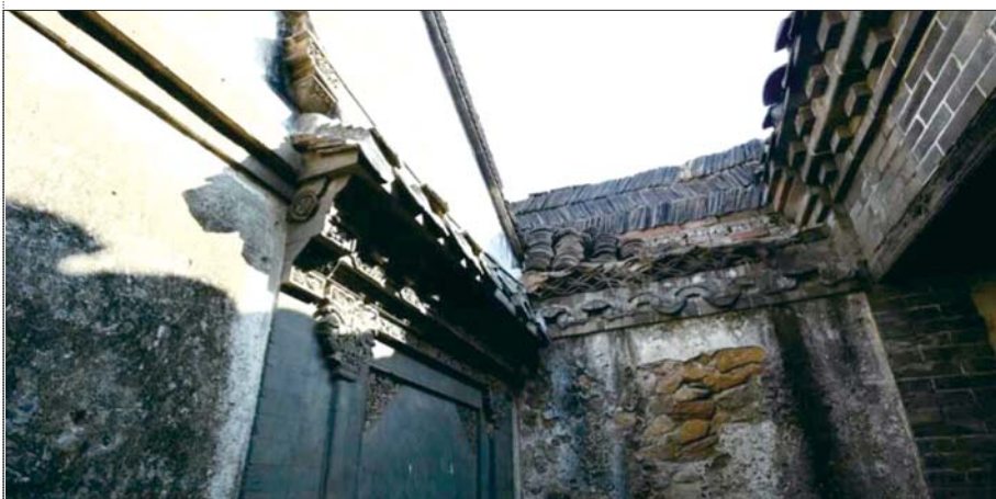
斑驳的建筑映射着昔日的繁华(资料片)

据青岛市城市建设档案馆的原始资料记载:回澜阁曾在1940年经历了一次重要整修,时任青岛市市长的赵琪曾于当年写下《重修回澜阁记》一文,文中盛赞“改修南端之亭,令为结构焕然一新”。回澜阁取“砥柱中流,狂澜易挽”之义,而当时整修回澜阁的原因是“风雨剥蚀榱宇凋落”。