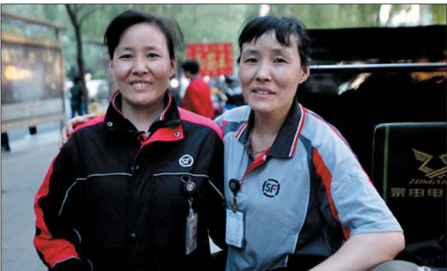
►常年奔波让姐妹俩看上去比实际年龄大许多。