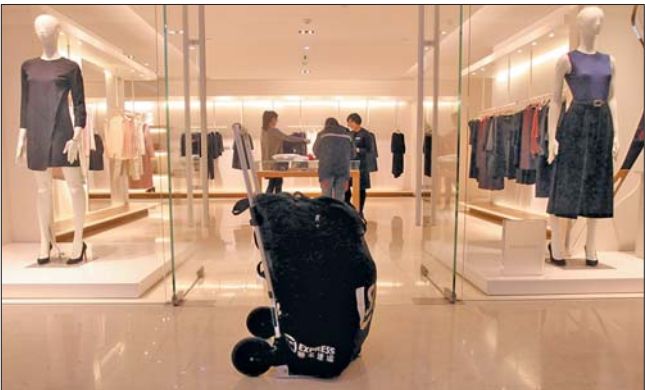
►忙的时候,取货车子就放在门外。