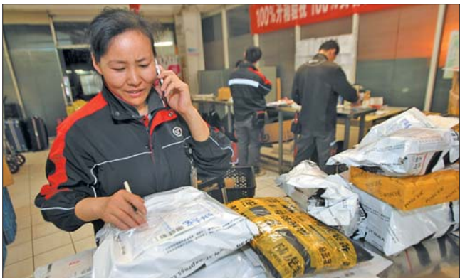
◀打包接听电话,快递员一天几乎都这样度过。