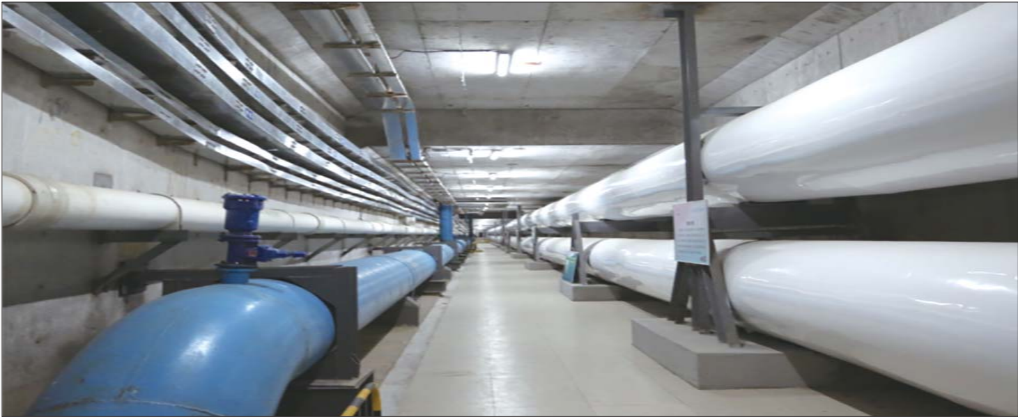
二环西路的地下综合管廊