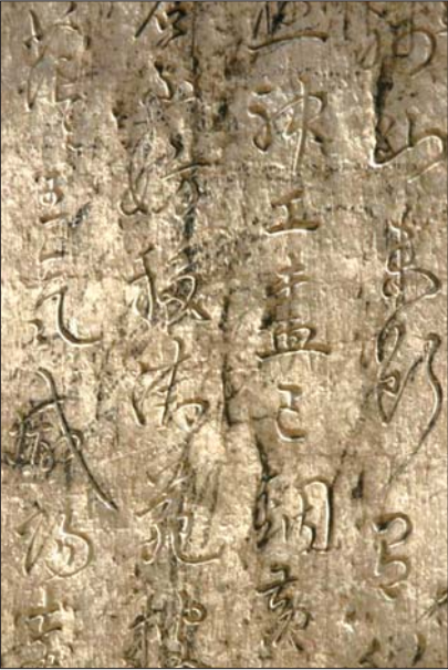
金山大洞两侧,有历代石刻四十余块。

因为南昌海昏侯墓的考古发掘成果太过显著，西汉废帝、海昏侯刘贺的故事逐渐为人所知。其实，在刘贺的第一故乡——巨野县的昌邑国，还有一处千古奇观——巨野金山崖墓。