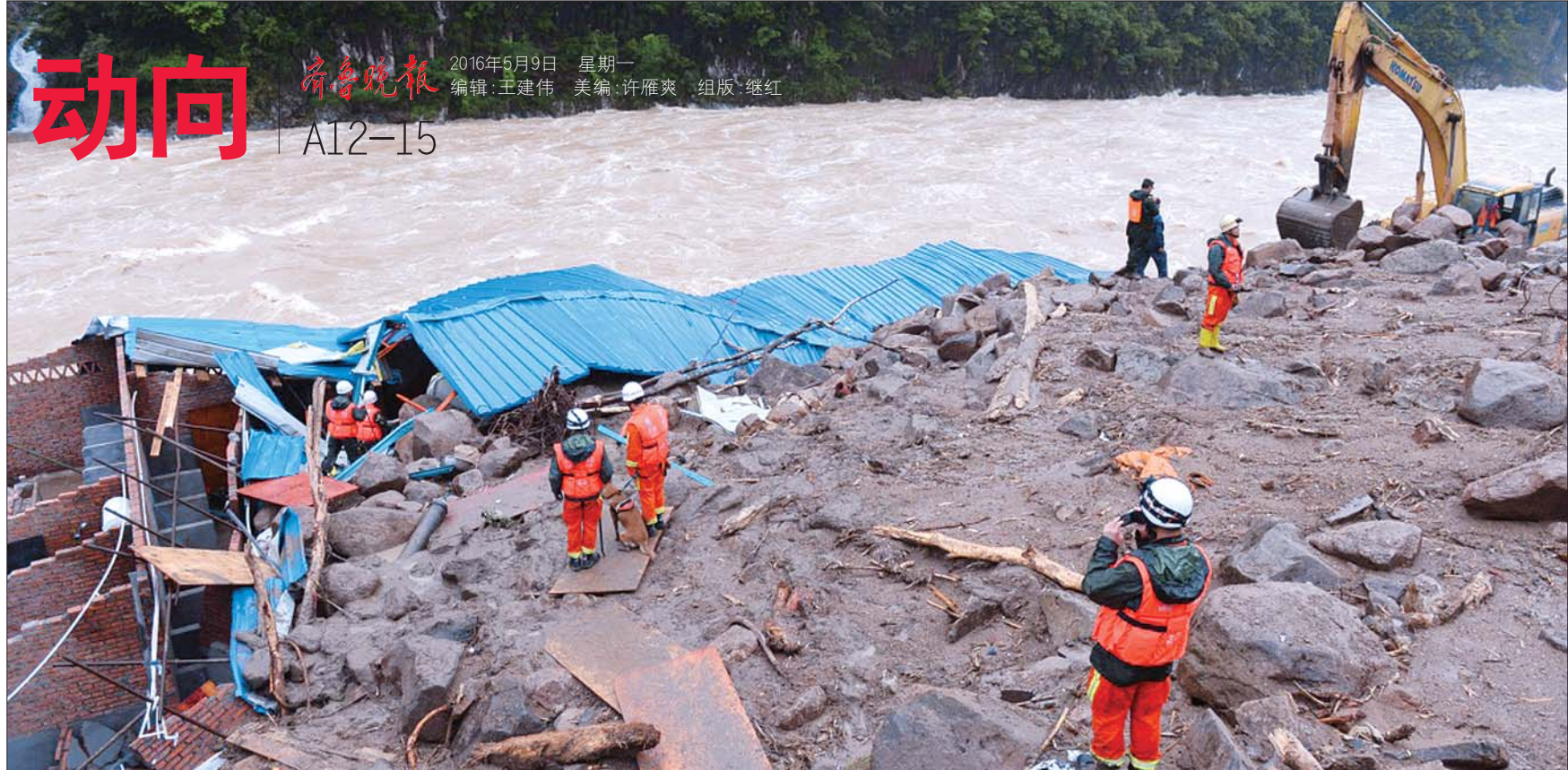
5月8日,武警、消防官兵现场展开搜救。