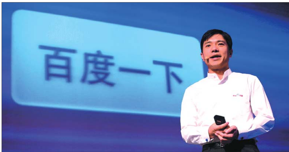
百度CEO李彦宏(资料片)。

而从5月2日起截至5月10日凌晨美股收盘,百度股价从每股185.33美元跌到了169.49美元。目前百度的流通股数为3.5亿股。如此计算,从“魏则西事件”爆发算起,百度已经“蒸发”市值55.44亿美元,合人民币超过360亿元。