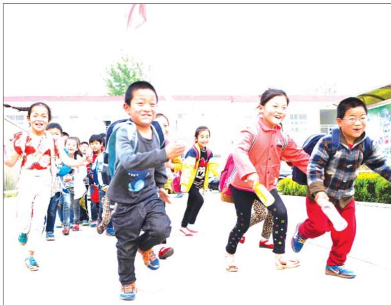
进城上学是不少孩子的梦想。(资料图)

入学积分实行网上集中申报、部门并联审核、分值现场确认、积分排名公示四个步骤。具备入学基本条件随迁子女的父(母)在规定时间内进行网上申请报名,填报积分入学申请表。待网上申报成功后,到指定地点进行相关证件证明材料审验并赋分,积分结果现场确认。所提供的证件证明材料要真实有效且为随迁子女父(母)或其他法定监护人的。