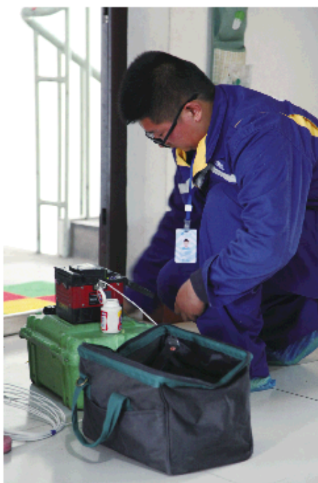
济宁移动工作人员正在上门为用户安装宽带。

2014 年伊始,济宁移动积极响应国家“宽带中国”战略,加大“光纤”宽带的投资,不到两年的时间,在全市已实现了 100 多万用户的网络全覆盖,济宁移动有线宽带服务已延伸到社区、乡镇及村庄。而 50M 光纤宽带的开启,也让人们的“网上”生活更丰富多彩。