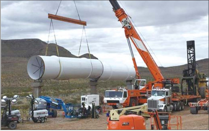
近日,施工人员在拉斯韦加斯以北的沙漠中搭建测试装置。

正在寻找一种更高效经济的方式来建造这种超级高铁。“我们希望呈现超级高铁所能实现的最大价值:安全、高效、随时满足需求、快速,但我们希望在革命性的成本基础上来实现它。” Hyperloop One公司还宣布,已完成新一轮8000万美元的融资,引进了包括法国国家铁路公司在内的一些新投资者。 超级高铁是一种远距离运输方式,可以让人以时速1125公里的速度旅行。实质上,它就是排出空气形成真空空间的长管道,它悬浮于地面之上,以便减小天气和地震对其影响。乘客可以选择单人舱或多人舱,然后在磁力作用下加速。可乘坐6到8人的车厢每隔30秒钟发车。建造从洛杉矶到旧金山的“超级高铁”估计需要160亿美元,而有的批评家认为项目需要1000亿美元。 综合新华社等消息