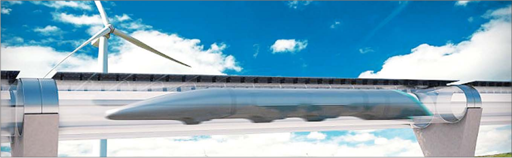
美国超级高铁在高架管道里运行的想象图。