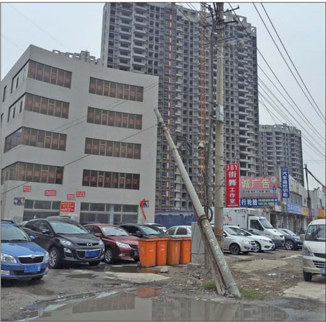
财富广场处倾倒的电线杆。