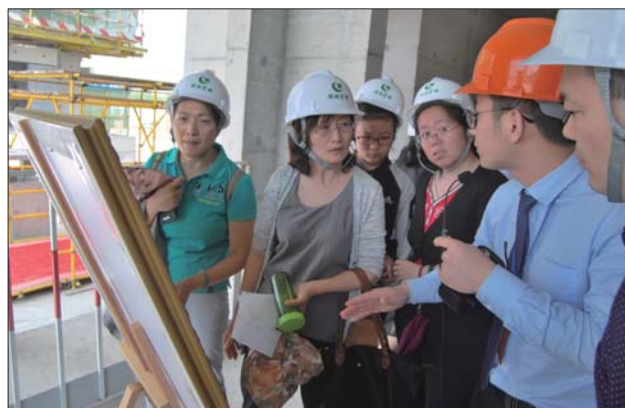
项目工程师为业主们现场讲解兰园楼盘的建筑特点。