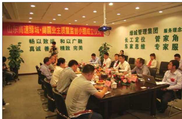
5月7日上午，兰园业主质量监督小组正式成立。