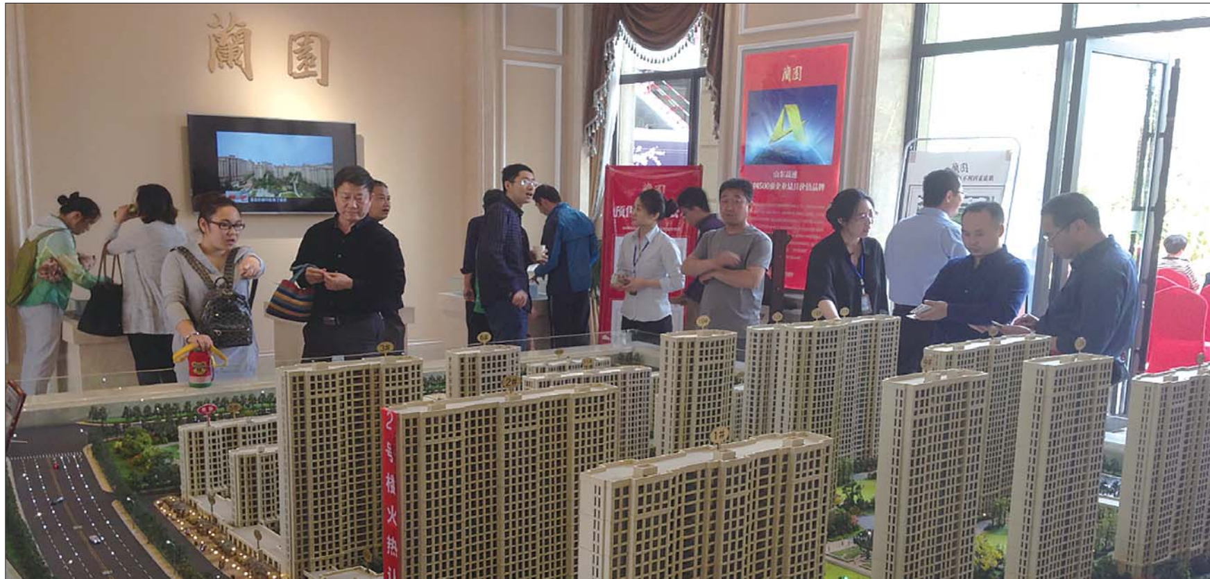
兰园营销中心大厅。