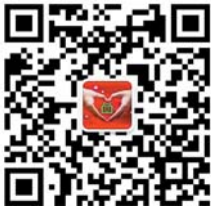
齐鲁健康大讲堂微信

抗癌明星报名投票仍在继续,报名方式:1、关注“齐鲁健康大讲堂”(微信号:qjkjdt),点击右下方抗癌明星按钮,进入投票页面投票,报名可点击页面右侧+,填写信息报名;2、电话报名方式请在工作时间(上午 900—下午 500),拨打报名电话 96706120 进行报名。