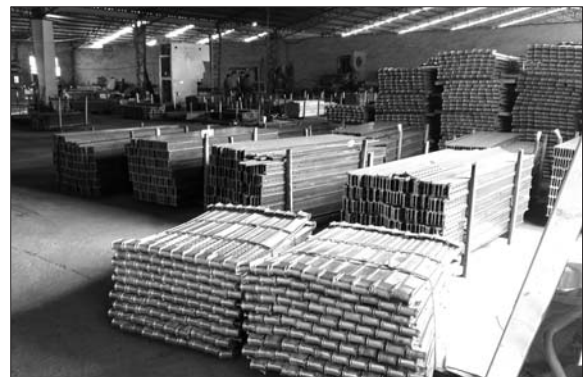
鹏程集团针对用户需求投入千万元研发新产品,换回3亿元订单。

一边是产能过剩,一边是各类需求无法满足。当前,中国经济面临的这种结构性矛盾正快速蔓延到各个行业,这也从另外一个角度证明,市场并没有饱和,而是市场供应与更高品质、更多元化的需求存在错位,推动要素效率革命、解决低效率洼地已经刻不容缓,这也为企业转型发展、寻找新动能提供了新机遇。